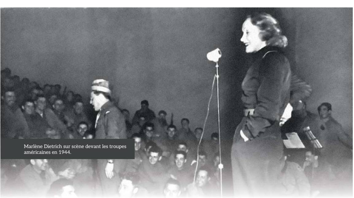
Marlène Dietrich sur scène devant les troupes américaines en 1944.