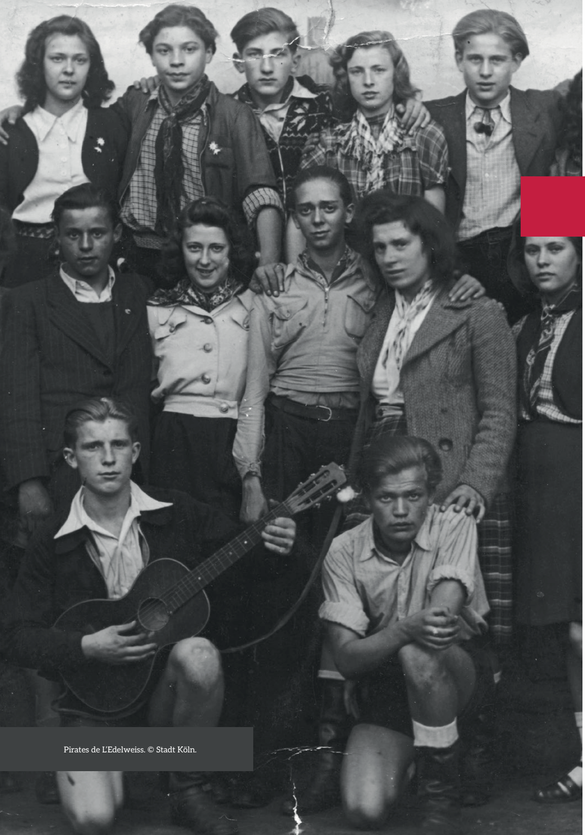
Pirates de L'Edelweiss.