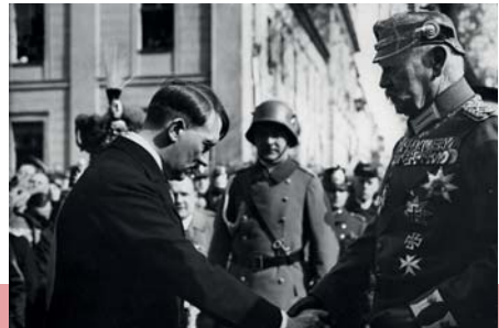
Hitler s'incline devant le maréchal Hindenburg pour l'accueillir

Le 20 mars 1933, le premier camp de concentration nazi, le camp de Dachau, est inauguré près de Munich. Entre 1933 et 1945, l'Allemagne nazie et ses alliés mettent en place plus de 44 000 camps et autres lieux d'incarcération, y compris dans les territoires occupés durant la Seconde Guerre mondiale, pour y enfermer et y éliminer « les ennemi-es de l'État ». En 1939, c'est le camp de Ravensbrück qui ouvre ses portes. Il deviendra rapidement