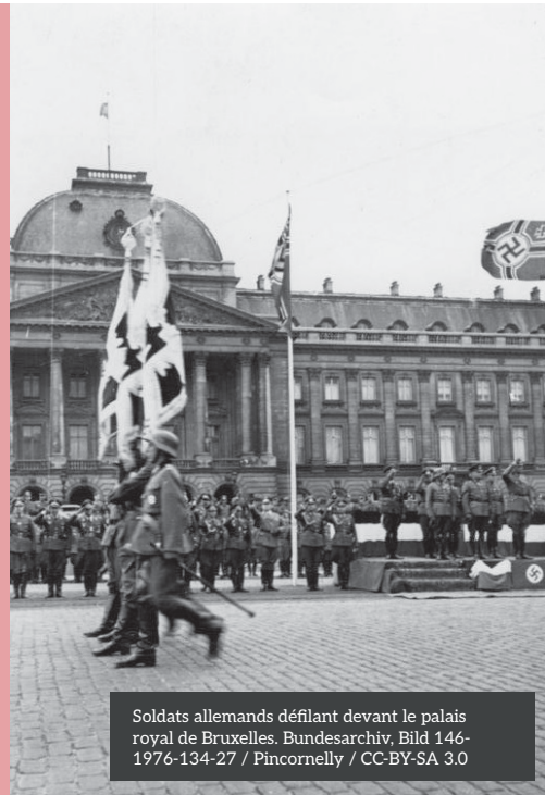
Soldats allemands défilant devant le palais royal de Bruxelles.