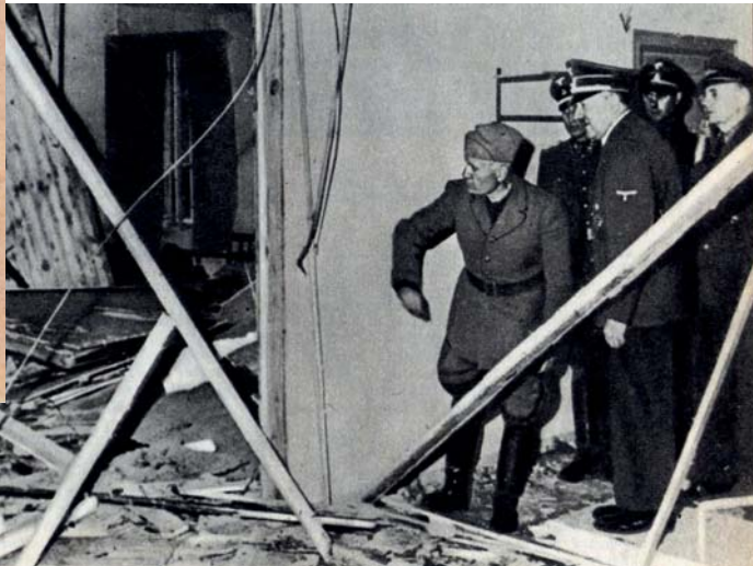
Hitler présente à Benito Mussolini les dégâts occasionnés par l'attentat du 20 juillet 1944.