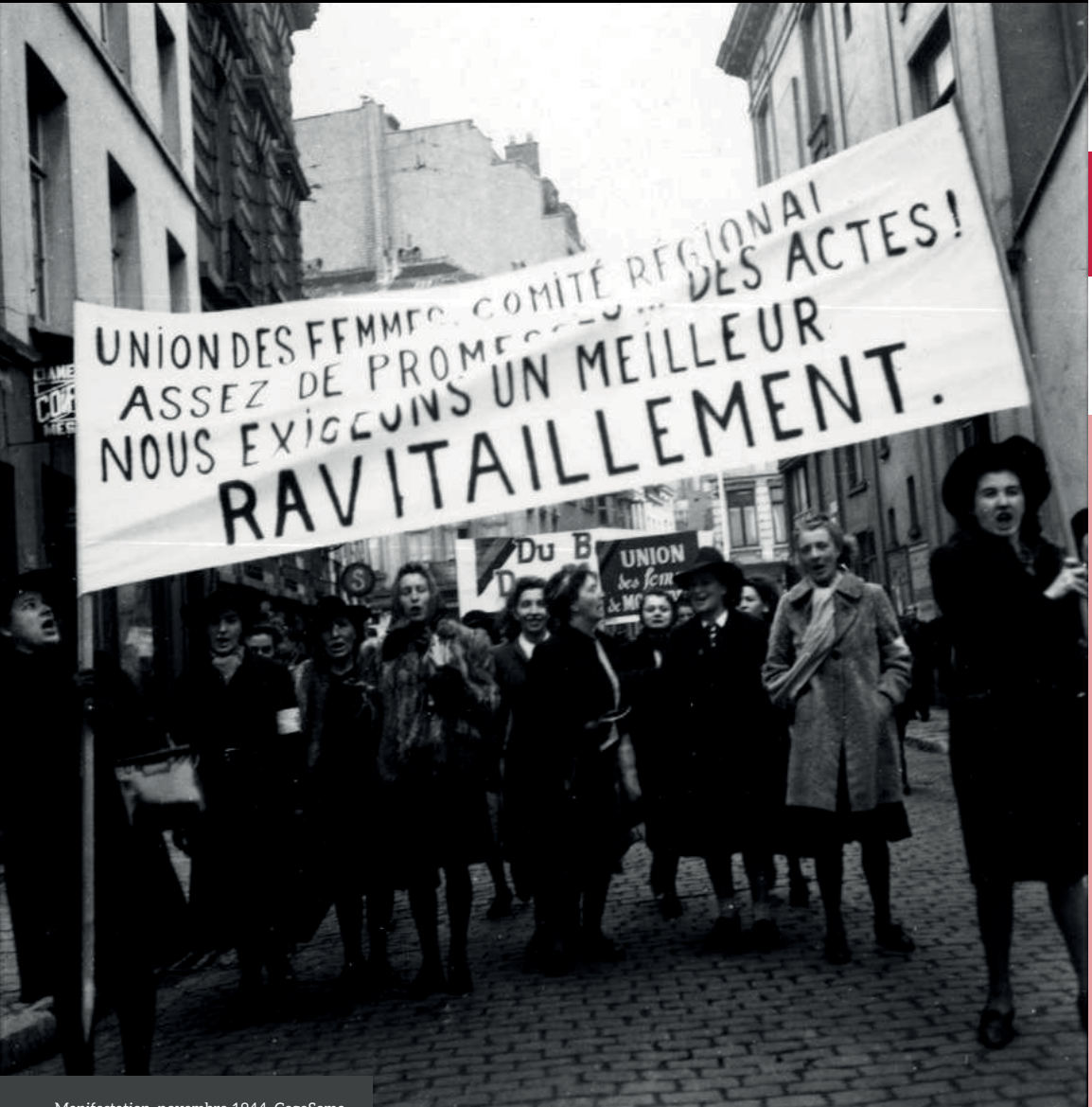
Manifestation, novembre 1944.