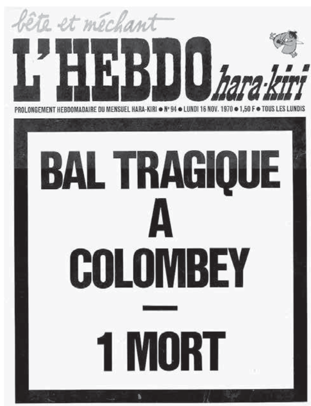
L'hebdo Hara-Kiri (n°94, 1970) polémique associant ironiquement la mort du Général De Gaulle à un fait divers de l'époque

liers d'exemplaires. L'année suivante, le libraire François Maspero ouvre sa maison d'édition dont le catalogue présente de nombreux écrits engagés contre la guerre (ce qui lui attirera l'hostilité des autorités). En 1960, Maspero persiste dans cet esprit contestataire en rejoignant d'autres intellectuels signataires du Manifeste des 121 , « Déclaration sur le droit à l'insoumission dans la guerre d'Algérie ».