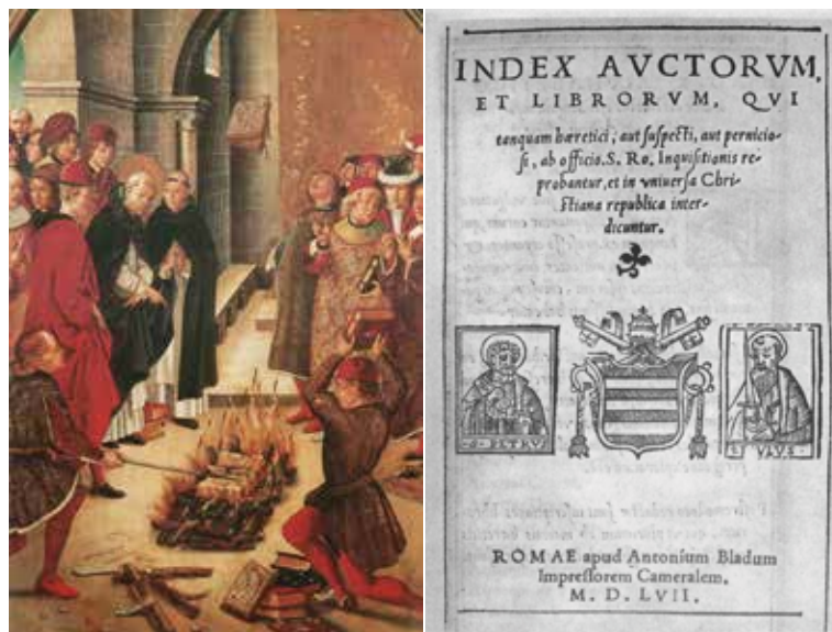
Illustrations représentant un autodafé au XV e siècle et une des premières listes de livres interdits (ou littéralement « mis à l'index ») par l'institution catholique romaine datant de 1557

En occident, la surveillance des textes commence à véritablement se formaliser au début de l'ère chrétienne. Pendant longtemps, la publication de livres est soumise de facto à l'approbation des officialités ecclésiastiques. Gargantua (1534) et Pantagruel (1532) de François Rabelais sont plusieurs fois fustigés, mais aussi les travaux de scientifiques tels que Nicolas Copernic ou Galilée.