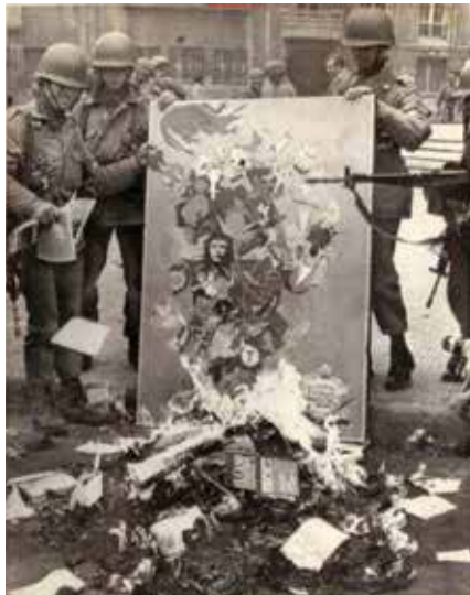
Autodafé de littérature marxiste au Chili en 1973 (CIA)