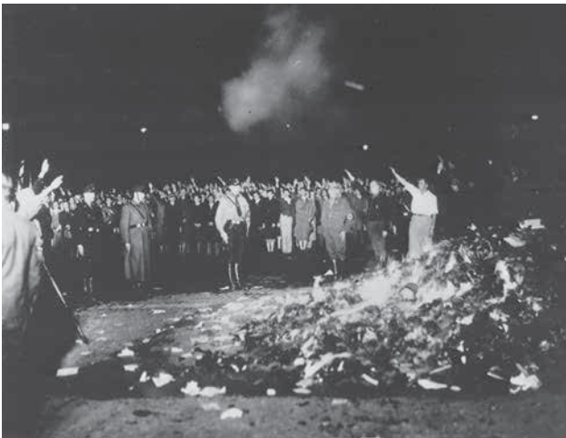
Autodafé du 11 mai 1933 à Berlin.

Dans une même perspective, au sein des pays occupés, les nazis complètent leur politique propagandiste par des limitations à la liberté d'expression. Ces dernières se traduisent par l'établissement d'ordonnances instaurant l'épuration ou la censure préalable 22 . Par exemple, des pressions sont exercées simultanément sur les différents maillons de la chaîne du livre : édition, imprimerie, librairie, distribution – un contrôle est également effectif sur les importations de livres étrangers – bibliothèques. L'Occupant s'assure ainsi de la collaboration des groupements professionnels du secteur. Il tente en outre de noyauter ces syndicats avec des personnes pro-allemandes et crée de toute pièce des organismes professionnels largement inféodés à l'idéologie nazie (par exemple, lancement en 1942 de la Société Européenne des Écrivains) 23 . En agissant de la sorte et en promotionnant les Lettres allemandes et scandinaves 24 , les nouvelles autorités visent un remodelage des structures mentales des lecteurs.