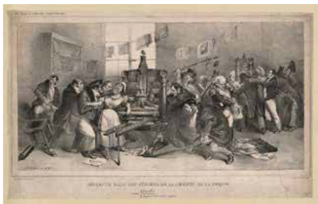
Descente dans les ateliers de la liberté de la presse, v. 1832, lithographie de Grandville (1803-1847). Divers représentants de la Monarchie de Juillet, dont le roi Louis-Philippe lui-même, s'évertuent à bâillonner la liberté de la presse