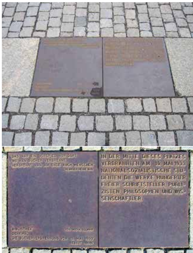
Plaque commémorative du premier grand autodafé nazi en mai 1933 sur la Bebelplatz à Berlin

Pendant la Seconde Guerre mondiale, l'instauration d'une « chape de plomb » et les autodafés n'ont pas étouffé les flammes d'espérance des résistants qui ont poursuivi le combat en utilisant abondamment l'imprimé.