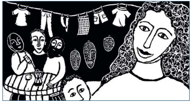
L'usine désaffectée, la maison de Paco