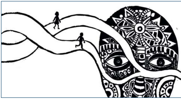
Les origines de Paco