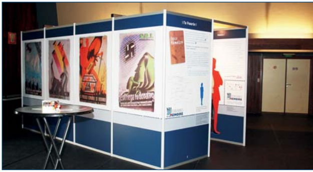
Vue de l'extérieur (les affiches)