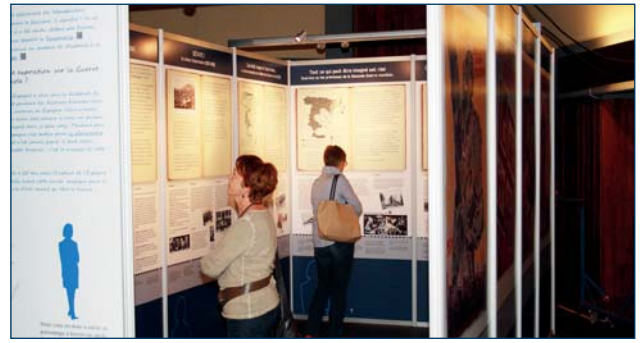
Vue de l'intérieur (le contenu)

À travers cet outil des Territoires de la Mémoire, les visiteurs de l'exposition « No Pasarán » découvriront qu'il est indispensable de se rassembler, aujourd'hui encore, pour dire « non ! » au fascisme.