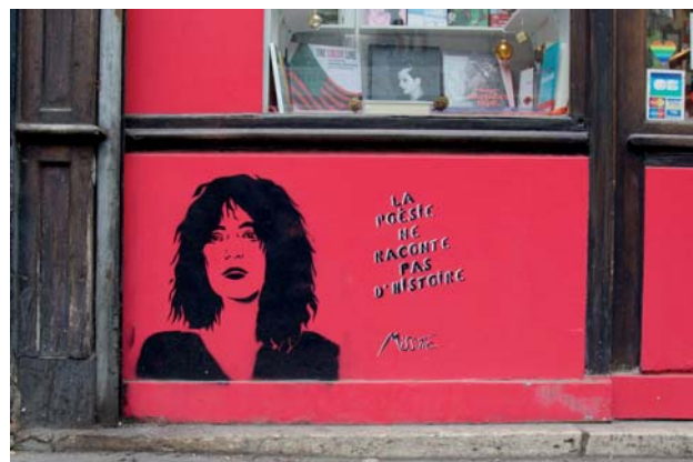
Graffiti de Miss.Tic, Paris, 2016