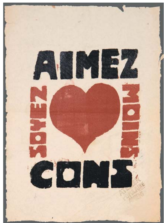
Sérigraphie sur papier, 1968, Centre de la gravure et de l'image imprimée, La Louvière