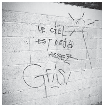
Graffiti, Liège, rue Hors-Château, 9 janvier 2019

Quand il parle de ce qu'il appelle l'« état poétique », Edgar Morin valorise, lui aussi, cette façon d'être au monde en accord avec cette part de nous-mêmes. Il y voit ce quelque-chose qui nous soulève, une ardeur, un élan, ce qui « nous met dans un état second très particulier, une sorte d'état qui comporte émerveillement, une jouissance particulière de l'esprit et qui réveille en vous une force extraordinaire ». Il avance : « Vivre poétiquement, c'est quand même je crois la chose qui justifie l'existence. Tellement d'êtres humains sont condamnés à n'avoir que quelques moments fugitifs de poésie dans la vie et à être asservis à des tâches prosaïques que vraiment on peut dire que c'est une revendication anthropologique et presque politique aujourd'hui. (...) une capacité de regarder le monde où on est, avec cet autre regard ». « Bien entendu, il ne faut pas [dit-il] verser dans l'euphorie et dire qu'on peut vivre dans l'enchantement. (...) Je conçois au contraire que c'est parce qu'on puise des forces, des énergies dans l'état poétique, dans l'émerveillement et dans l'amour qu'on a la force de se révolter contre les ignominies et les horreurs de ce monde. »