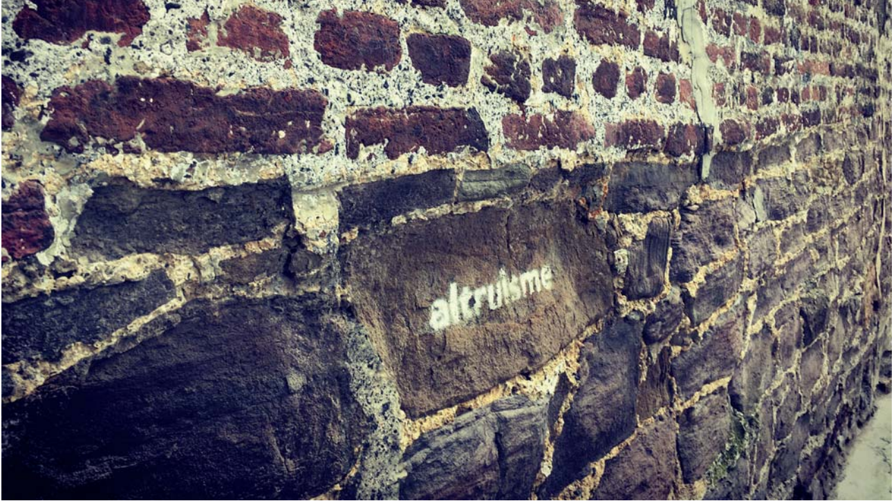
Pochoir, Liège, Au Péril, 24 février 2018