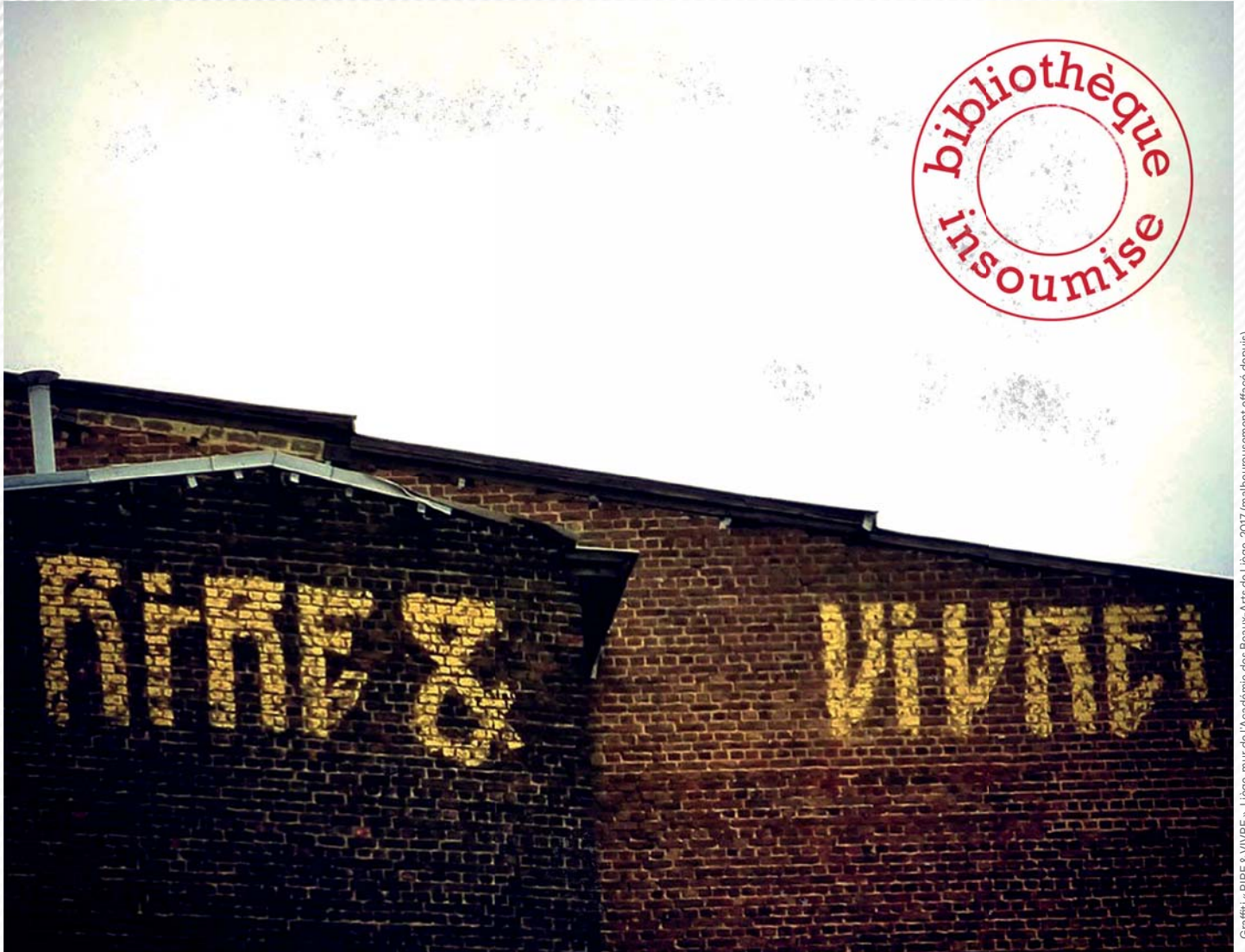
Graffiti « RIRE & VIVRE », Liège, mur de l'Académie des Beaux-Arts de Liège, 2017 (malheureusement effacé depuis)