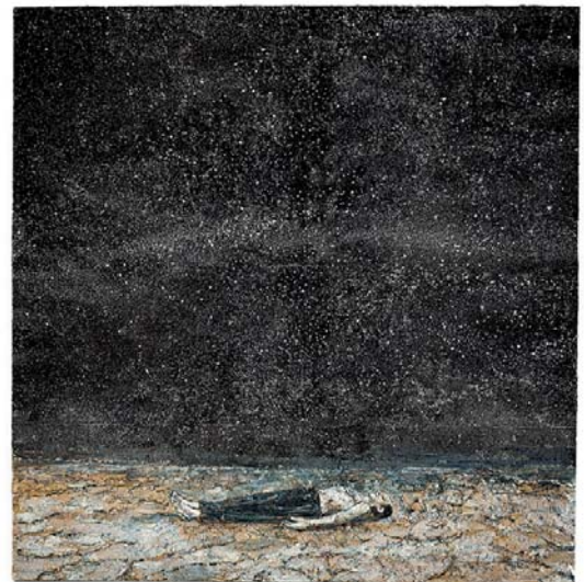
Anselm Kiefer, « Ordres de la Nuit » ( Die berühmten Orden der Nacht ), 1997