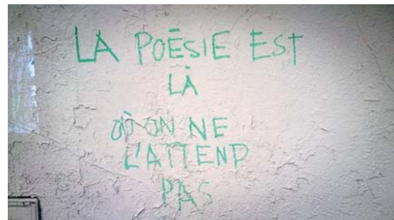
Graffiti, Paris, rue de la Roquette, novembre 2013

Écrits derrière les barreaux, ces vers nous donnent à voir, « lorsque nous fermons les yeux, le paysage hikmetien qui s'impose à nous, (...) cette vue du mont Uludag que le poète avait de la fenêtre de sa prison de Brousse (...). Cet extrait du poème À propos du mont Uludag vaut cent longs récits de captivité. Tout y est : rapports de force, immobilité imposée, insoumission du regard et foi latente en la libération (de celles qui soulèvent les montagnes). »