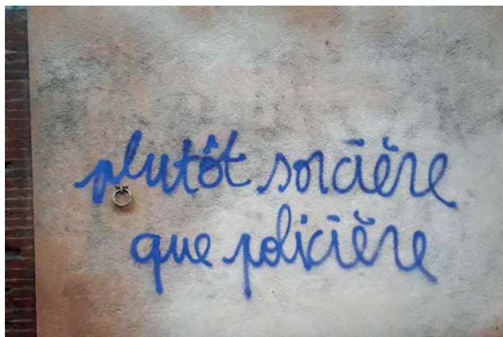
Collectif Auto Média étudiant, Toulouse, 27 janvier 2019