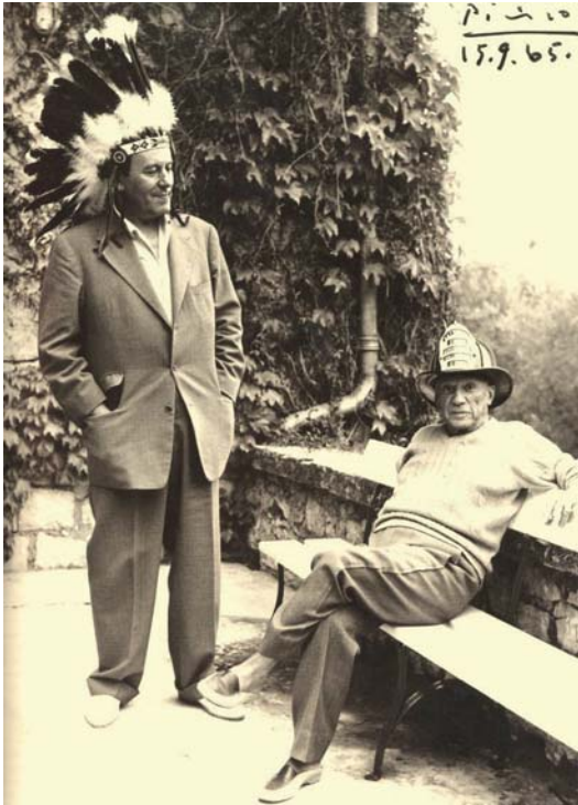
René Char et Pablo Picasso, 1965