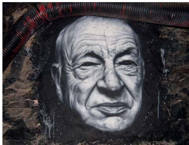
Portrait d'Edgar Morin, Thierry Ehrmann, Musée L'Organe

André Breton écrit pour sa part : « Je n'ai jamais éprouvé le plaisir intellectuel que sur le plan analogique. Pour moi, la seule évidence au monde est commandée par le rapport spontané, extra-lucide, insolent qui s'établit, dans certaines conditions, entre telle chose et telle autre, que le sens commun retiendrait de confronter. Aussi vrai que le mot le plus haïssable me paraît le mot donc , avec tout ce qu'il entraîne de vanité et de délectation morose, j'aime éperdument tout ce qui, rompant d'aventure le fil de la pensée discursive, part soudain en fusée illuminant une vie de relations autrement féconde (...). » 18